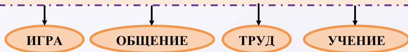
Анализ статей журнала "Начальная школа" (за последние 5 лет) и анкетных данных

Средства формирования - это активная деятельность воспитанника, которая используется в воспитательном процессе для решения конкретных воспитательных задач. (В.С. Селиванов)