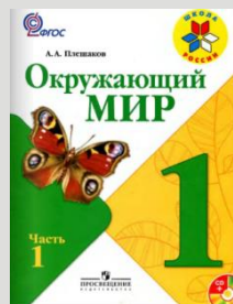
УМК «Школа России»

В связи с намеченной проблемой, нами были разработаны задания на формирование у детей умений правильно задавать вопросы в соответствии с учебной задачей.