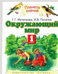
УМК «Планета знаний»

При анализе учебников было замечено, что присутствует мало заданий на формирование у детей умения правильно задавать вопросы. Ведь постановка вопросов – это процесс сотрудничества в поиске и сборе информации.