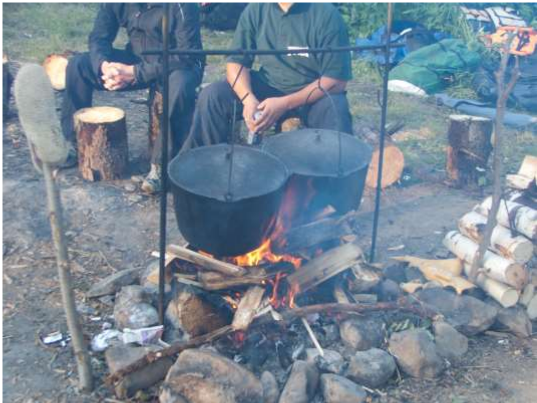
Рис. 7. Подвеска котлов на заранее изготовленных металлических опорах.