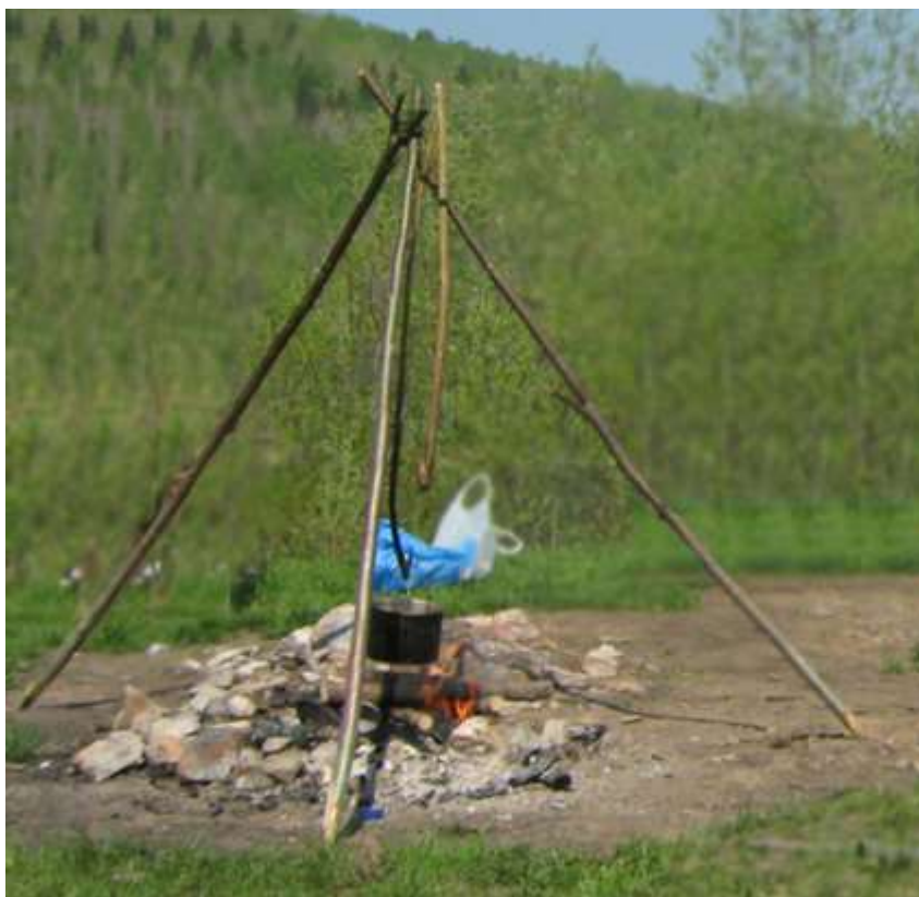
Рис. 8. Подвеска котлов при помощи треноги из жердей.