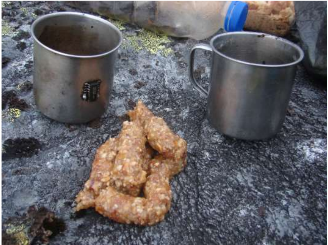
Рис. 11. Смесь из меда, орехов и кураги