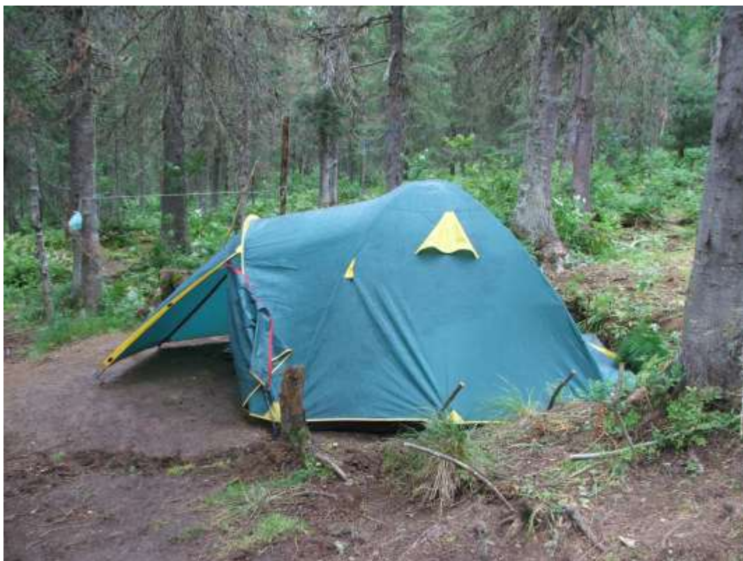
Рис. 4. Современные каркасные двухслойные палатки