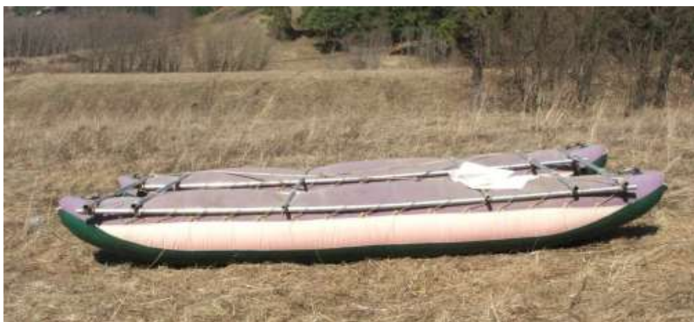
Рис. 1. Катамаран