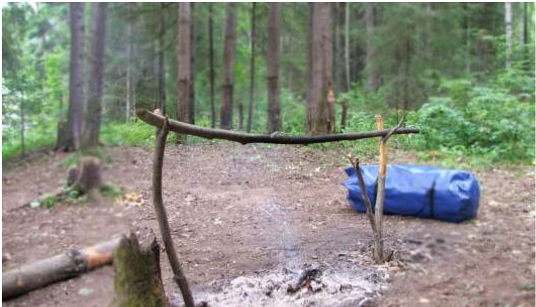
Рис. 6. Подвеска котлов при помощи жердей.