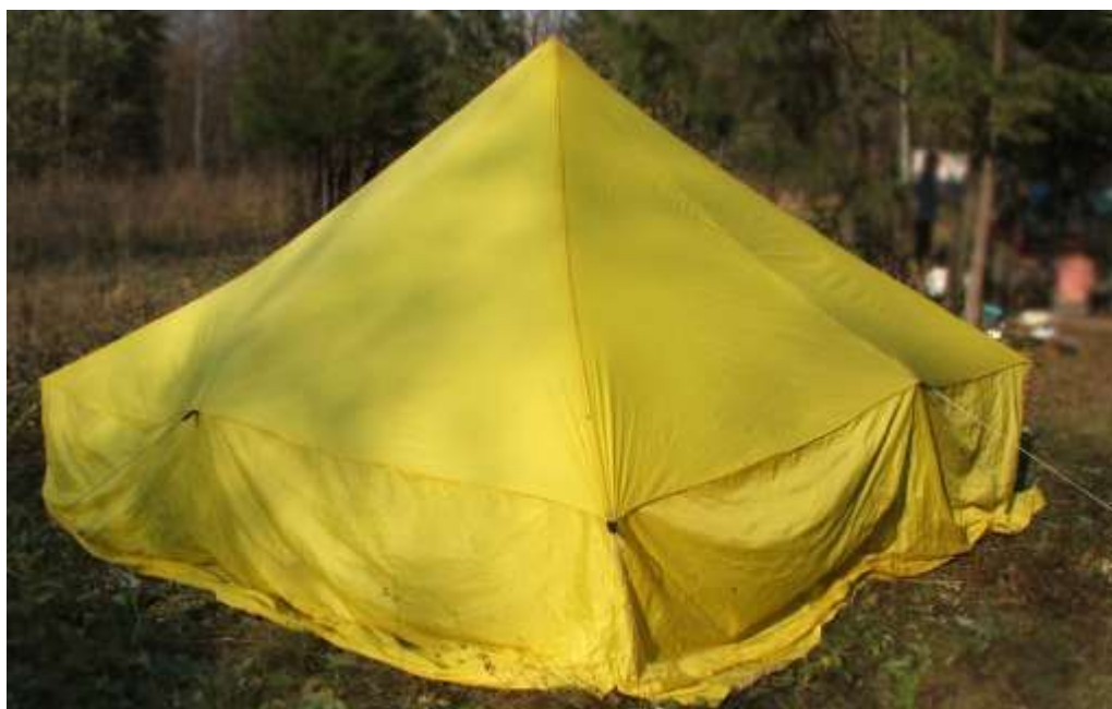
Рис. 5. «Зимняя» палатка (типа шантер)