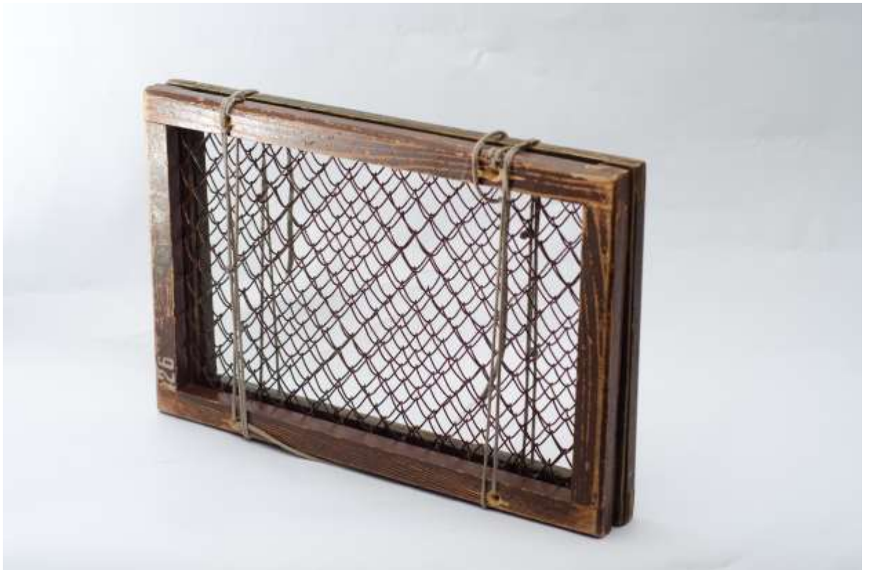
Рис.12. Гербарный пресс