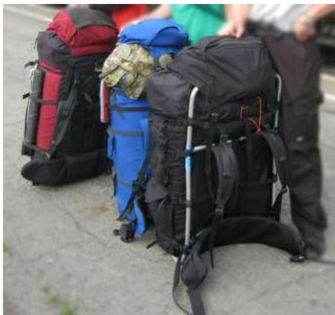
Рис. 3. Туристические (Экспедиционные) рюкзаки