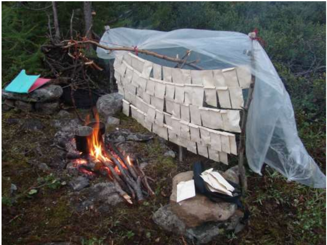
Рис. 15. Сушка образцов лишайников и мхов в полевых условиях.