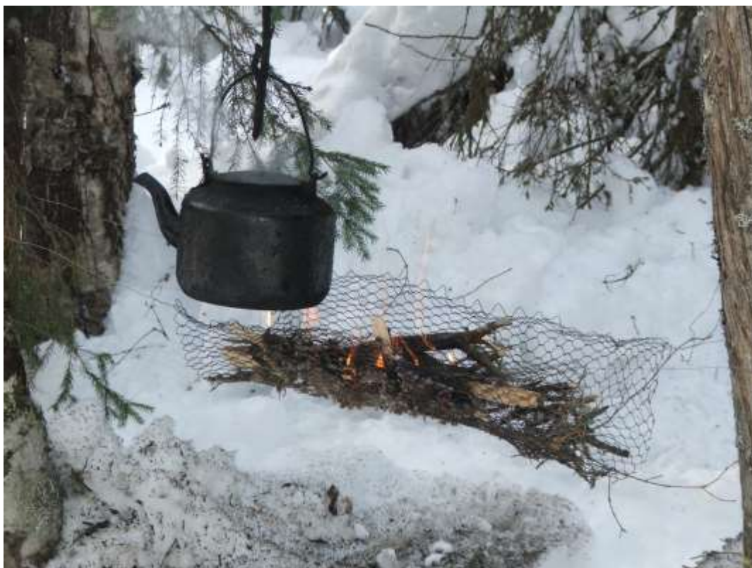
Рис. 10. Подвеска котлов при помощи металлического троса растянутого между опор, костер располагается на костровой сети.