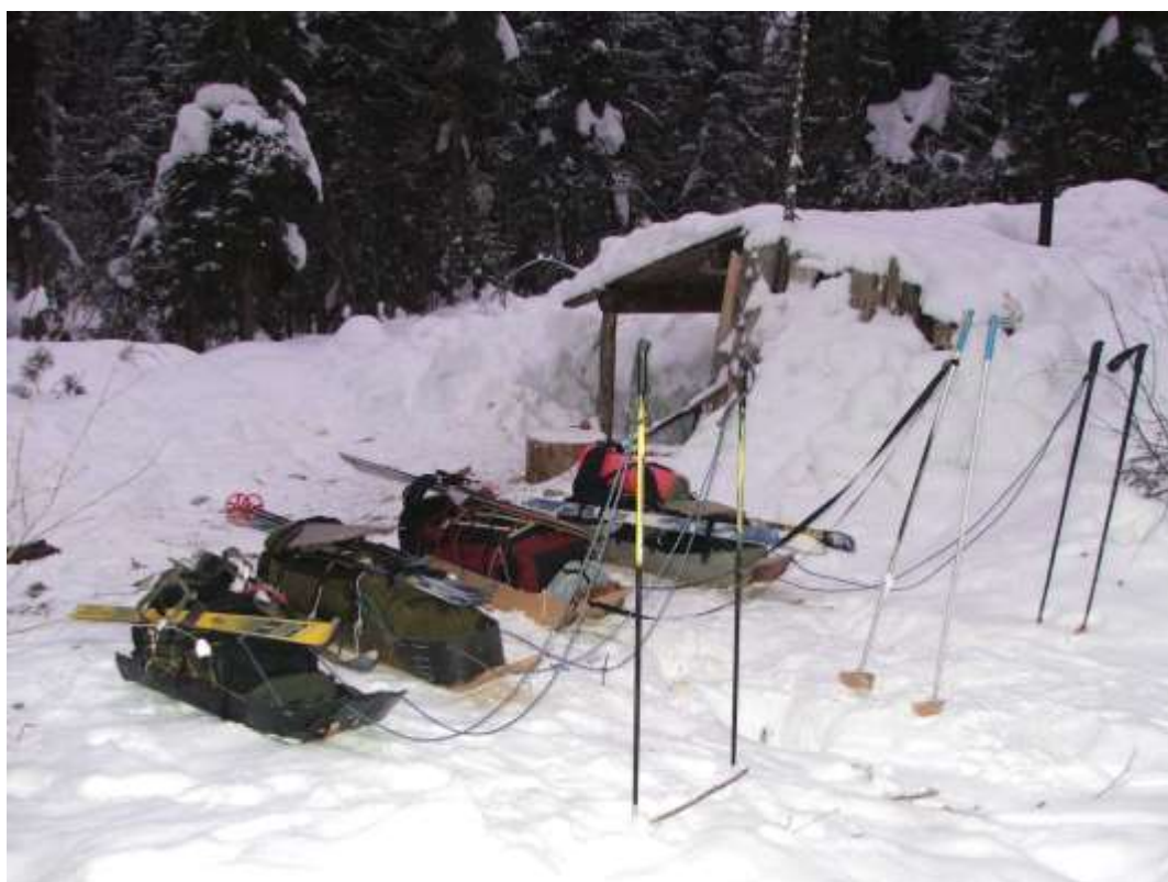
Рис. 2. Самодельные Волокуши